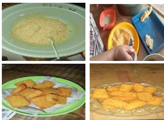
Gambar 3. Hasil Pembuatan Nugget Kelompok Ibu-Ibu PKH

Setelah diberikan pelatihan dan pendampingan, kelompok ibu-ibu PKH Desa Cinunjang dan Desa Giriwangi didorong untuk membentuk kelompok kecil untuk membuat nugget, yang nantinya hasil dari pembuatan nugget tersebut dapat dijual dengan kemasan dalam bentuk Frozen Food . Dari 15 orang kelompok ibu-ibu PKH di setiap Desa, dibagi kedalam 3 kelompok terdiri dari 5 orang/kelompoknya. Hasilnya 2 dari 3 kelompok berhasil mengimplementasikan pembuatan nugget dan diperjualbelikan pada masyarakat sekitar. Peningkatan keterampilan secara kognitif dan non-kognitif yang diberikan pada masyarakat dirasa cukup efektif manakala bagian terkecil dari masyarakat menyadari akan pentingnya aktivitas ekonomi yang perlu diperjuangkan. Hasil dari pembuatan nugget yang dilaksanakan oleh kelompok ibu-ibu PKH dapat dilihat pada gambar berikut: