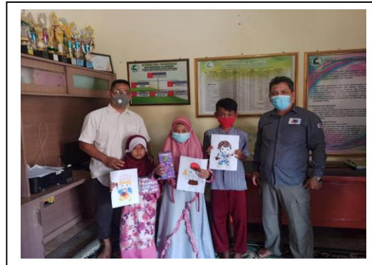
Gambar 3. Foto bersama dengan para pemenang lomba

Selanjutnya diadakan perlombaan menggambar dan mewarnai antar anak-anak di panti asuhan tsb. Kegiatan selanjutnya dilakukan dengan pemberian hadiah untuk para pemenang seperti terlihat pada Gambar 3, 4, 5 dan 6.