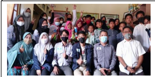
Gambar 2. Foto bersama kegiatan bersama anak-anak dan Peurus Panti Asuhan Siti Khadijah

Selanjutnya pemberangkatan BKM UCIC ke panti asuhan. Dipanti asuhan, BKM dan sivitas akademika UCIC disambut oleh pengurus dan anak-anak dari Panti Asuhan Siti Khadijah, terlihat pada Gambar 2.