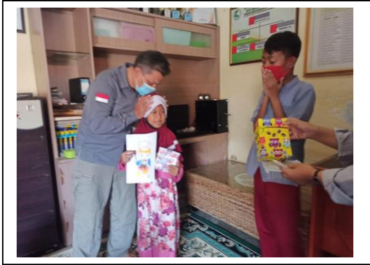
Gambar 7. Penyerahan Hadiah untuk pemenang

Diakhir kegiatan dilakukan pemberian hadiah serta pemberian donasi untuk panti asuhan Siti Khadijah. UCIC berharap dapat kedepannya Panti Asuhan Siti Khadijah ini dapat terus menjadi jalinan silaturahmi dan membangun kebersamaan