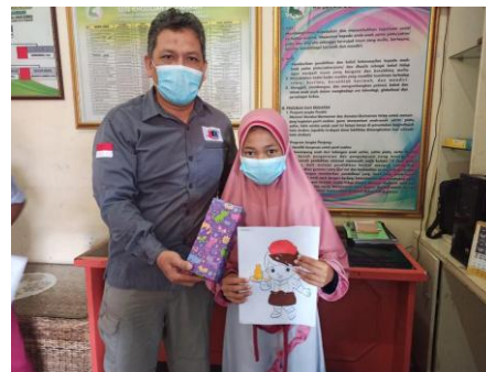
Gambar 6. Penyerahan Hadiah untuk pemenang