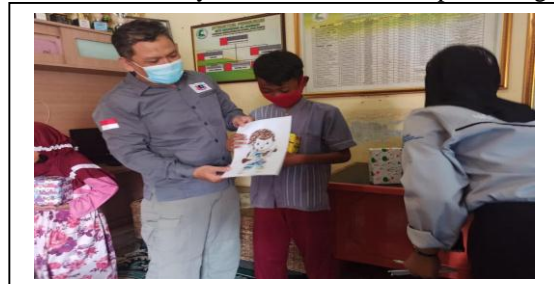
Gambar 5. Penyerahan Hadiah untuk pemenang