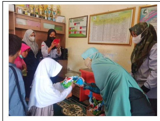
Gambar 4. Penyerahan Hadiah untuk pemenang

Selanjutnya diadakan perlombaan menggambar dan mewarnai antar anak-anak di panti asuhan tsb. Kegiatan selanjutnya dilakukan dengan pemberian hadiah untuk para pemenang seperti terlihat pada Gambar 3, 4, 5 dan 6.