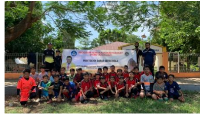
Gambar 2. Foto Bersama mitra

Kesempatan yang sangat berharga ini tidak disia-siakan walau disadari bahwa mulai dari sarana dan peralatan kegiatan ini sangatlah terbatas. Tetapi dengan semangat yang kuat dan dorongan dari para pelatih dan dosen maupun guru olahraga, menjadikan kegiatan ini menjadi kegiatan yang bermanfaat