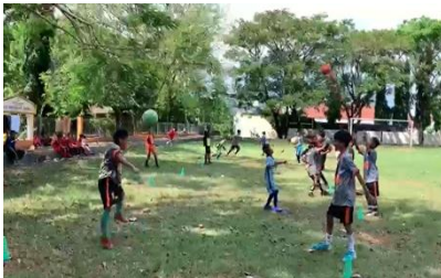
Gambar 1. Pelaksanaan materi praktek

Berdasarkan hasil kegiatan lanjutan pelatihan ini, menunjukkan bahwa apa yang diajukan dalam perumusan masalah dapat terlaksana dengan baik dan terarah. Dari hasil pelaksanaan kegiatan ini menemukan jawaban bahwa minat para siswa SD Inpres Prumnas Antang III Kota Makassar untuk mengetahui tambahan pengetahuan pelatihan aturan permainan dan teknik dasar olahraga permainan sepakbola yang baru sangatlah tinggi, walaupun dalam kegiatan sebelumnya mereka telah memahami dan menguasai materi teknik dasar permainan sepakbola tersebut. Sehingga antusias mereka dalam mengikuti materi, baik itu pada saat teori maupun praktek taktik dan strategi tersebut itu tetap terjaga dan tidak pernah menurunkan motivasi mereka dalam mengikuti kegiatan pelatihan tersebut karena pelatihan tersebut dipandang sangat berguna untuk diri mereka. Kemampuan teknik dasar dalam sepakbola yang harus dikuasai, meliputi : menendang bola, mengontrol bola, gerak tipu, tackling , lemparan ke dalam dan teknik penjaga gawang(Ramadhan, Surisman, and Jubaedi 2020)