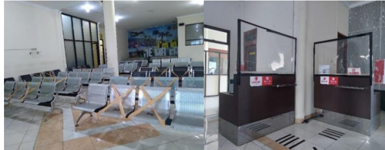
Gambar 5. Penanda jaga jarak di Terminal Keberangkatan

Bandar Udara Notohadinegoro sudah menaati peraturan jaga jarak karena sudah disediakan penanda jaga jarak sehingga petugas dan penumpang diwajibkan untuk menyesuaikan dengan penanda jaga jarak yang disediakan. Dokumentasi dari hasil observasi penulis yang menunjukkan penanda jaga jarak area terminal keberangkatan bagian check-in dan boarding gate di Bandar Udara Notohadinegoro dapat dilihat pada gambar berikut ini.