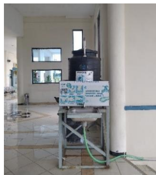
Gambar 7. Tempat cuci tangan di area masuk ke Bandar Udara

Saat ada kegiatan penerbangan di Bandar Udara Notohadinegoro menyediakan masker, sarung tangan, tempat cuci tangan dan hand sanitizer. Dokumentasi dari hasil observasi penulis dapat dilihat pada gambar berikut ini.