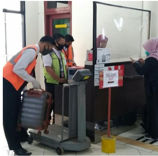
Gambar 3. Petugas pasasi area check-in counter menggunakan masker dan sarung tangan

Pelayanan di Bandar Udara Notohadinegoro wajib menggunakan masker, mencuci tangan dan menggunakan sarung tangan. Jika sedang tidak berinteraksi dalam pelayanan boleh melepas sarung tangan. Dokumentasi dari petugas pasasi area check-in menggunakan masker dan sarung tangan.