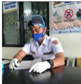
Gambar 1. Pengecekan suhu badan oleh petugas bandara

Orang yang melakukan kegiatan di Bandar Udara Notohadinegoro pada awalnya wajib cek suhu tubuh, dan bagi yang sakit dipersilahkan untuk istirahat. Dokumentasi pengecekan suhu badan oleh petugas bandara dapat dilihat pada gambar berikut ini.