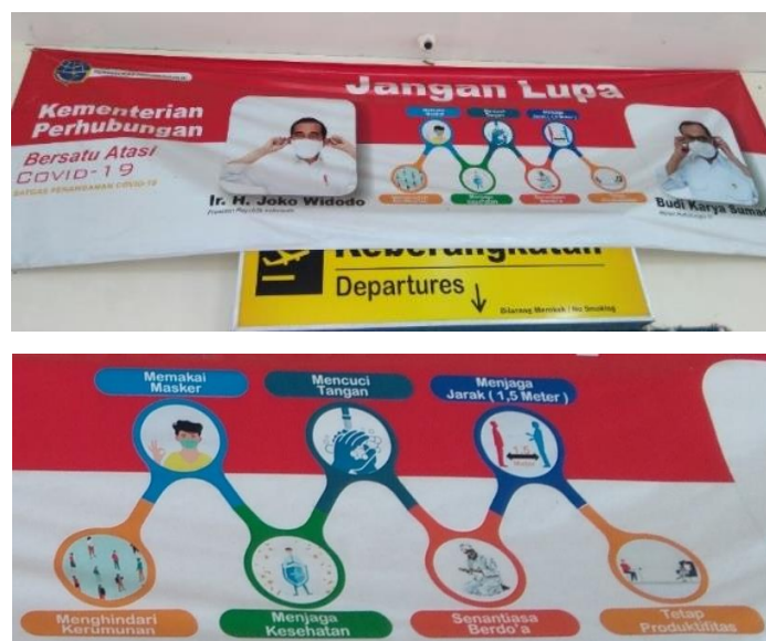
Gambar 4. Media Informasi Protokol Kesehatan

Penjelasan selanjutnya tentang protokol kesehatan yaitu Bandar Udara wajib memasang media informasi sebagai sosialisasi protokol kesehatan guna mengingatkan personel dan pengguna jasa di bandar udara terdapat media informasi agar mengikuti ketentuan pembatasan jaga jarak (physical distancing), mencuci tangan menggunakan sabun dengan air mengalir/hand sanitizer serta kedisiplinan menggunakan masker. Dokumentasi media informasi protokol kesehatan dapat dilihat pada gambar berikut ini.