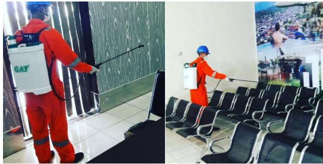
Gambar 9. Pembersihan dan penyemprotan oleh petugas Bandar Udara

Sebelum dan sesudah melakukan kegiatan penerbangan di Bandar Udara Notohadinegoro dilakukan penyemprotan dengan disinfektan dari pihak bandara. Dokumentasi dari kegiatan penyemprotan dengan disinfektan dari pihak bandara dapat dilihat pada gambar berikut ini.