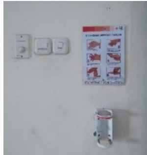
Gambar 8. Tempat penyediaan hand sanitizer di ruang check-in

Gambar di atas menunjukkan tempat yang disediakan di Bandar Udara Notohadinegoro. Untuk meningkatkan kebersihan, terdapat hand sanitizer di tempat yang banyak dilalui oleh orang. Dokumentasi dari hasil observasi penulis dapat dilihat pada gambar berikut ini.