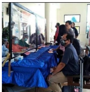
Gambar 2. Area pelaksanaan rapid test

Gambar di atas menunjukkan petugas sedang mencatat suhu badan orang yang melakukan kegiatan di Bandar Udara Notohadinegoro. Dalam perkembangannya, selain melakukan cek suhu tubuh, kalau ada penerbangan karyawan juga wajib tes rapid atau antigen. Dokumentasi yang didapat oleh penulis dapat dilihat pada gambar berikut ini.