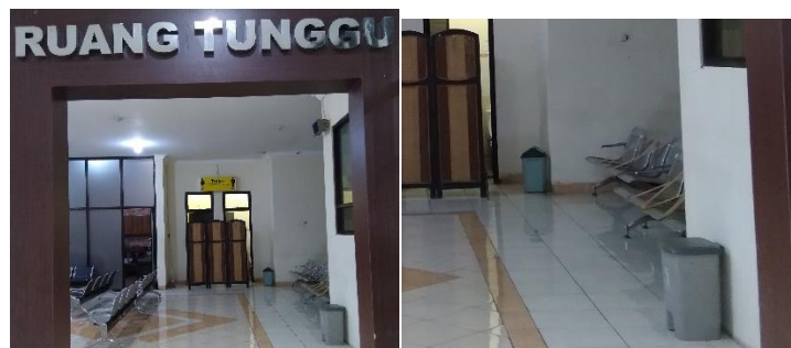
Gambar 10. Tempat pembuangan masker dan sarung tangan

Bandar Udara Notohadinegoro Jember telah menyediakan fasilitas tempat pembuangan masker dan sarung tangan. Berdasarkan hasil observasi dokumentasi penulis dapat dilihat pada gambar berikut ini.